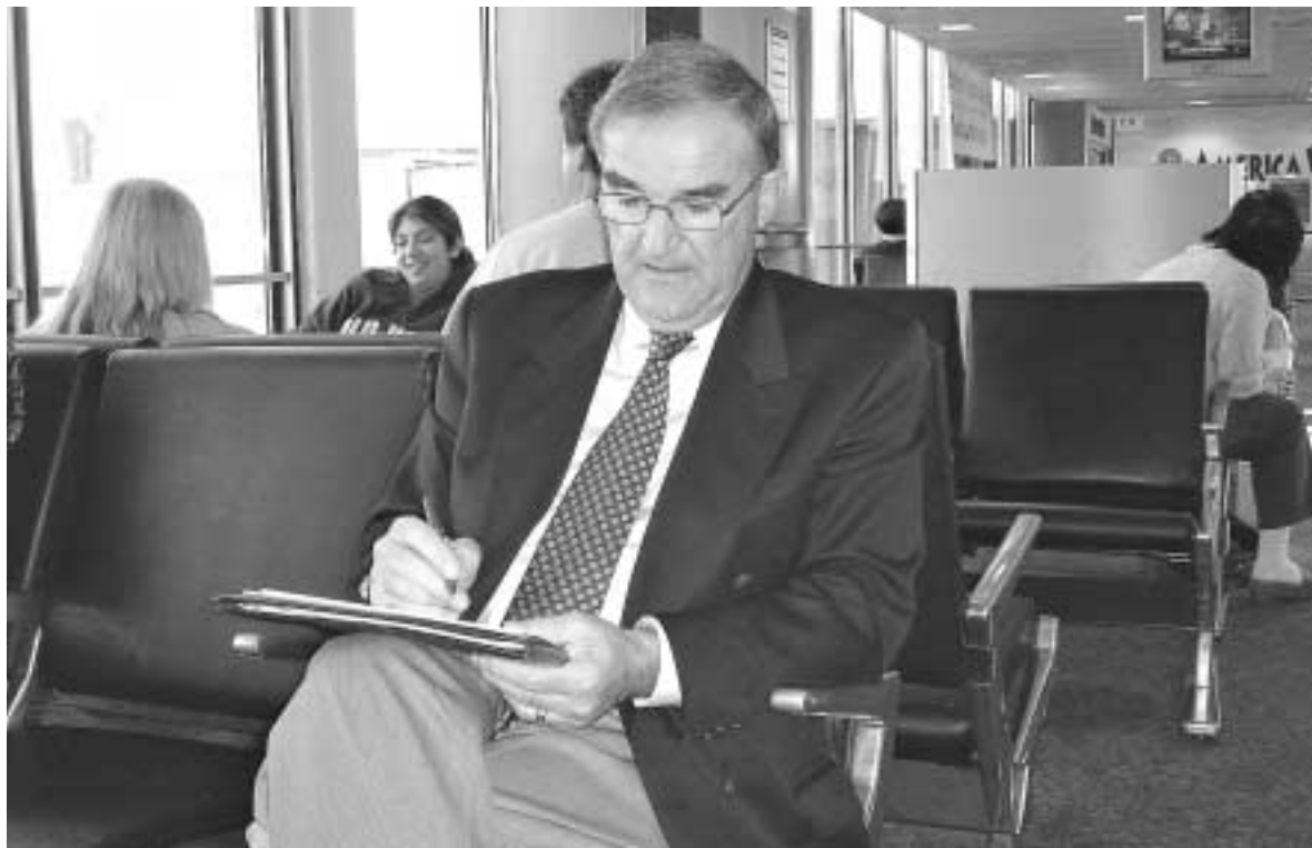
Το βιβλίο «Αρκαδία, Αρκαδία Μου» είναι το πρώτο λογοτεχνικό του συγγραφέα και αναμένεται να μεταφερθεί και στον κινηματογράφο, μετά το ενδιαφέρον που εξέφρασε ο Τζον Κουσακνς.