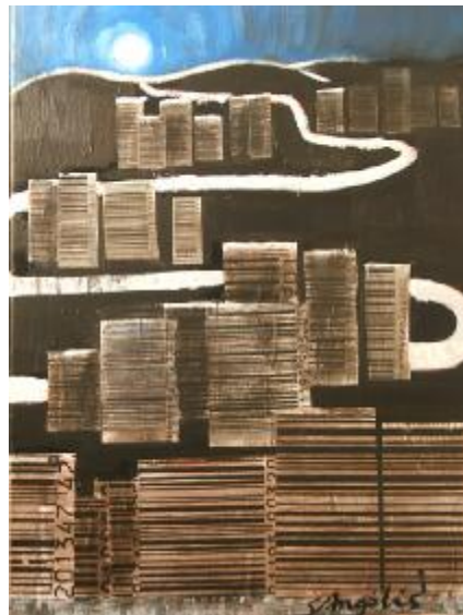
"Barcode City" 70x100 μικτή τεχνική