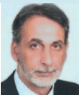
ΓΙΑΝΝΟΠΟΥΛΟΣ ΓΙΑΝΝΗΣ ΔΗΜΑΡΧΟΣ ΓΟΡΤΥΝΙΑΣ