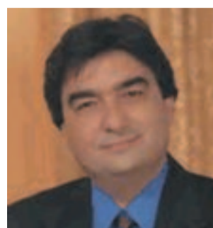
ΓΙΑΝΝΑΚΟΥΡΑΣ ΕΥΑΓΓΕΛΟΣ ΑΝΤΙΠΕΡΙΦΕΡΕΙΑΡΧΗΣ