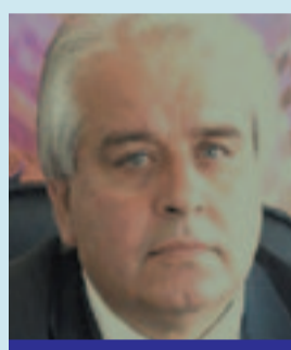
ΜΠΟΥΡΑΣ ΠΑΝΑΓΙΩΤΗΣ ΔΗΜΑΡΧΟΣ ΜΕΓΑΛΟΠΟΛΗΣ