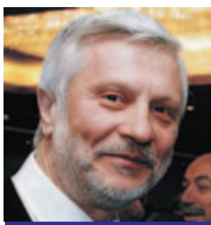
ΤΑΤΟΥΛΗΣ ΠΕΤΡΟΣ ΠΕΡΙΦΕΡΕΙΑΡΧΗΣ ΠΕΛΟΠΟΝΝΗΣΟΥ