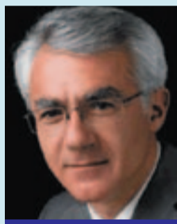
ΣΜΥΡΝΙΩΤΗΣ ΓΙΑΝΝΗΣ ΔΗΜΑΡΧΟΣ ΤΡΙΠΟΛΗΣ