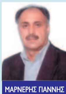
ΜΑΡΝΕΡΗΣ ΓΙΑΝΝΗΣ ΔΗΜΑΡΧΟΣ Ν. ΚΥΝΟΥΡΙΑΣ