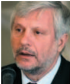
Πέτρος Τατούλης (π. Υπουργός & Βουλευτής της Ν.Δ.)