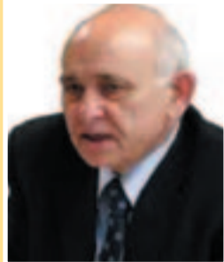
Δημήτρης Δράκος (Νομάρχης Μεσσηνίας & πρόεδρος της ΕΝΑΕ)